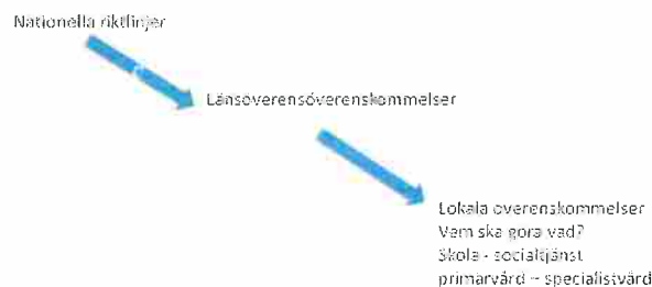
Bild 2. Översikt av professionernas styrande dokument, gemensamma för båda huvudmännen.

I landstinget hanteras informationsöverföringen genom att landstingsstyrelsens arbetsutskott inför varje styrgruppsmöte inhämtar aktuell information från den centrala ledningsgruppen.